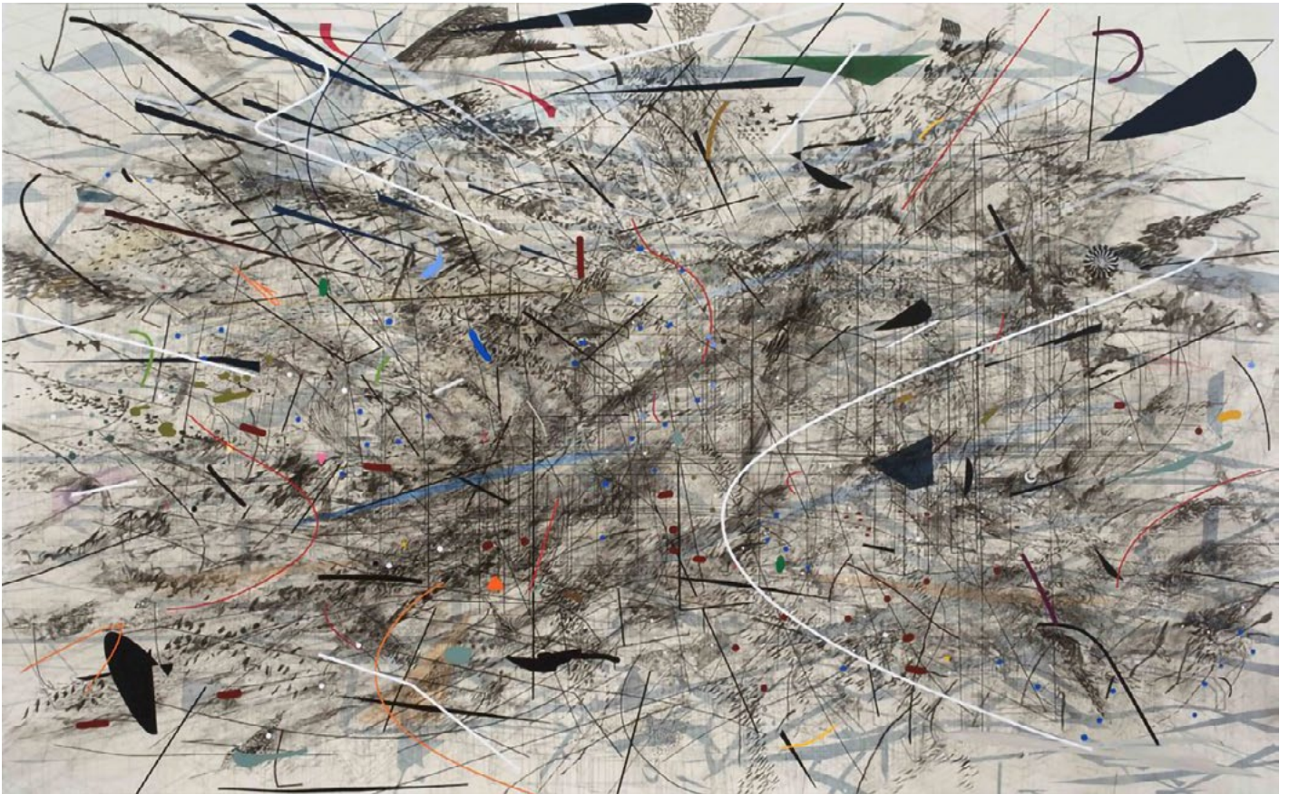
2. Julie Mehretu Black City , encre et acrylique sur toile, 305 x 489 cm, 2007.