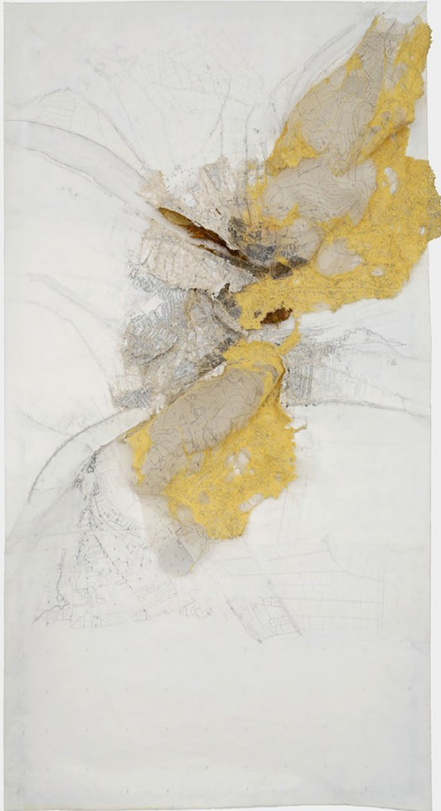
4. Cathryn Boch, N 43°18' 21.5" E 5° 22'03.0" , carte topographique, greffe de carte géologique sur papier calque, bétadine, strates de papier de Chine, couture main, couture machine, 207 x 107 cm, 2015. Courtesy Galerie Claudine Papillon