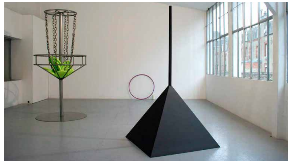
Sculptures performatives ( Human flag pot , Hula hooping whilst balancing a milk bottle on the head et Frisbee contest ), 2013. Vue de l'exposition Homemade Performance à 2Angles (Flers).

S'appuyant sur de multiples médiums, tels que le dessin, la vidéo, l'installation, la sculpture, celui-ci se réapproprie le protocole d'actes performatifs souvent tirés du Guinness book des records, des journaux ou encore de vidéos qu'il trouve sur internet. En quête de ces actes, au premier abord absurdes et sans finalité, il questionne les gestes du quotidien, faisant ainsi surgir ces performances héroïques et incongrues d'un réel trivial où le geste demeure socialement mesuré. En s'intéressant à la forme même du geste, il ne cherche pas à en intensifier l'aspect spectaculaire mais tente plutôt d'interroger tour à tour l'acte et son image. C'est avec une certaine économie de moyens que l'artiste en décortique les strates et les codes pour extirper de ces gestes leur fort potentiel poétique, au travers notamment d'objets qu'il reproduit ou utilise.