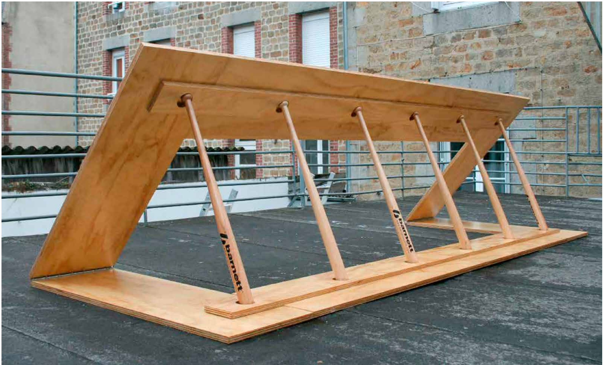
Baseball bat breaking Bois, batte de baseball, 3,30 x 1 x 1 m, 2013. Vue de l'exposition Homemade Performance à 2Angles à Flers