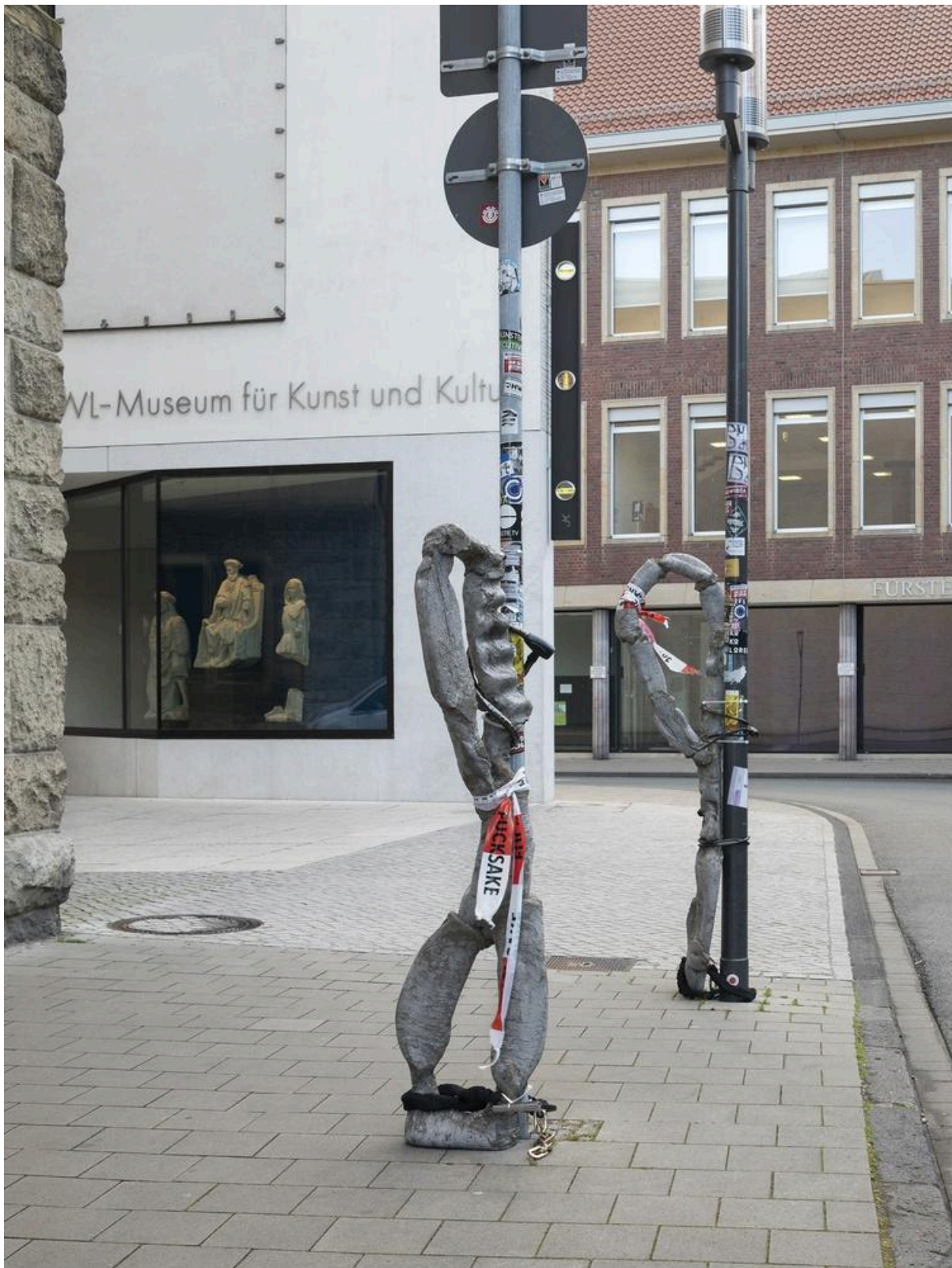
Michael Dean, Tender Tender , 2017, vue de l'installation. Skulptur Project, Munster. https://www.skulptur-projekte-archiv.de/en-us/2017/projects/179/