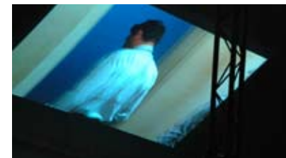
ATELIER MÉCANIQUE GÉNÉRALE