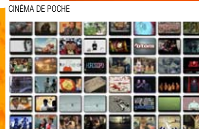
CINÉMA DE POCHE