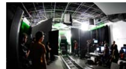
CINÉMA NUMÉRIQUE