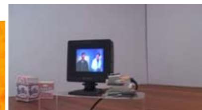
THE ALL SEEING EYE