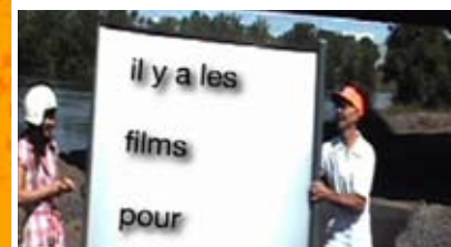
LE SOLEIL BRILLE POUR TOUT LE MONDE MAIS LES HOMMES PRÉFÈRENT LES BLONDES