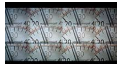
SCÉNOGRAPHIE D'ÉCRANS (PROGRAMMES)